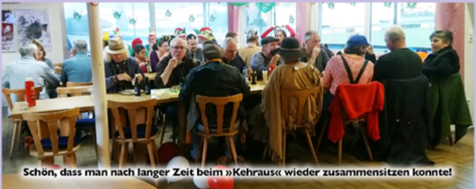
Schön, dass man nach langer Zeit beim »Kehraus« wieder zusammensitzen konnte!