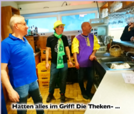
Hatten alles im Griff! Die Theken- ...