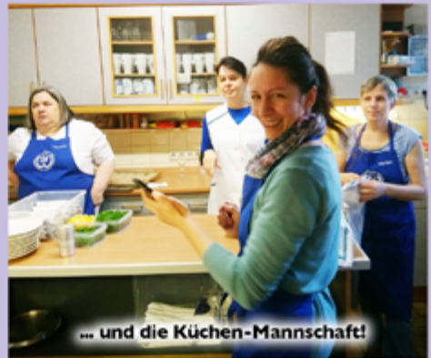
... und die Küchen-Mannschaft!