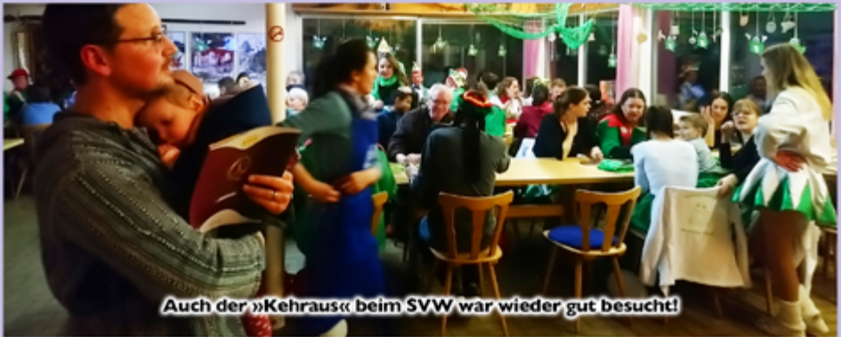
Auch der »Kehraus« beim SVW war wieder gut besucht!